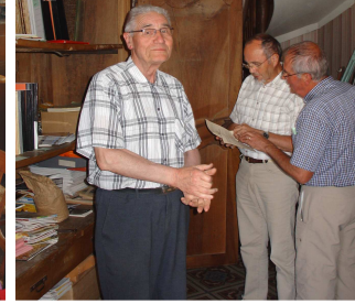
Moncoutant, juillet 2008