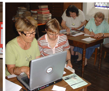
Réalisation d'un catalogue local avec support informatique, Lhonnaizé, juillet 2008