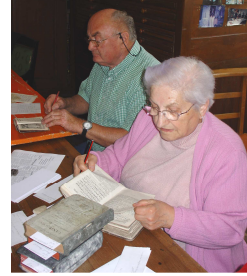
Lhonnaizé, juin 2008

Le partenariat consiste en une collaboration aux Archives historiques du diocèse de Poitiers de structures locales institutionnelles ou associatives. L'aide peut s'effectuer sous trois formes : financière, matérielle et de travail en commun sur des points particuliers selon la qualité des acteurs. Cette participation implique une relation de réciprocité entre les parties.