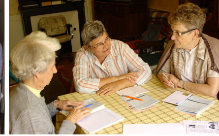
Persac, août 2008