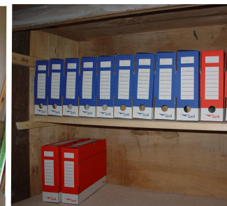
Conditionnement des archives, Queaux, avril 2008